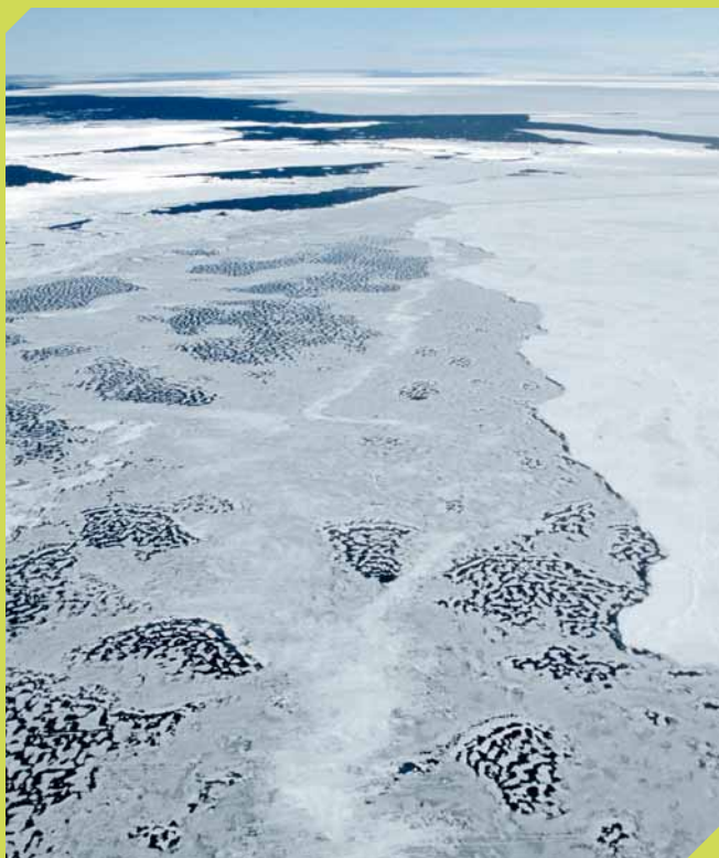
La banquise fond... (territoire canadien de Nunavut, en Arctique).

espèces ont du mal à s'adapter à des changements aussi rapides ! L'ours blanc figure parmi les animaux les plus menacés. Il vit sur la banquise de la baie d'Hudson, au Canada. Comme la banquise et les plaques de glace diminuent, son territoire de chasse diminue aussi et il ne peut pas suffisamment se nourrir, ce qui l'oblige à jeûner : il s'épuise énormément et devient vulnérable. De plus les femelles ne trouvent plus assez d'abris pour élever et protéger leurs petits, ce qui compromet leur survie.