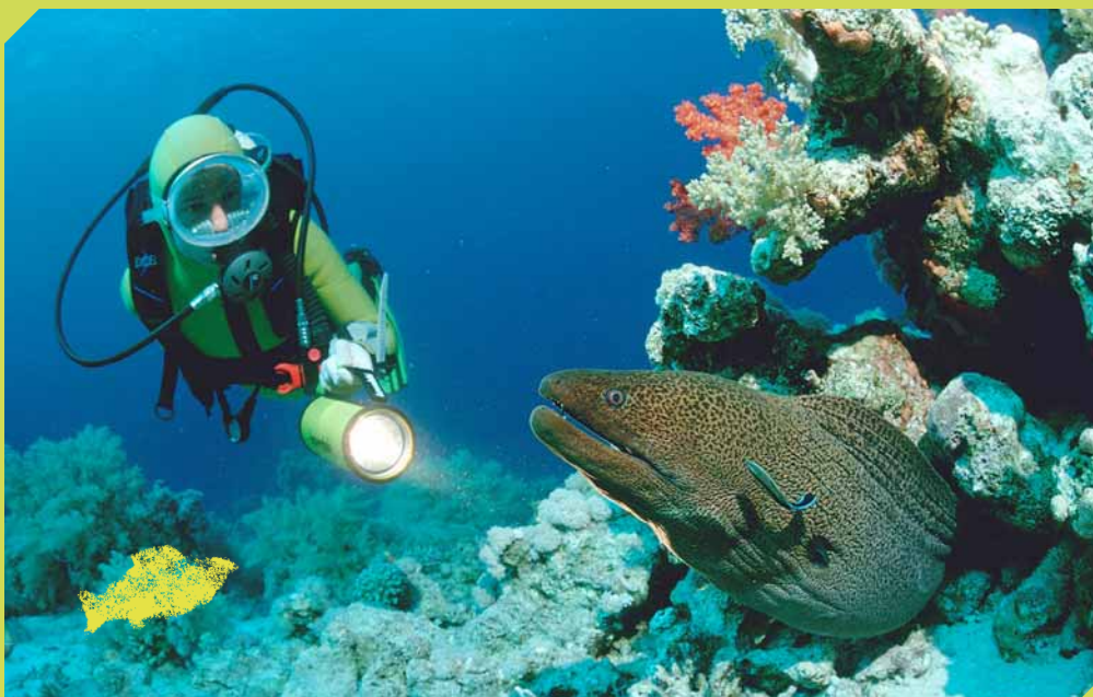
Un plongeur observe une murène géante sur un fond corallien.

Les animaux qui vivent sur ces plages sous-marines sont difficiles à observer, car, comme ils ne disposent pas d'abris où se cacher, ils se camouflent pour échapper à leurs prédateurs. Les poissons plats comme la raie s'ensablent pour mieux attraper les proies, des mollusques et des crustacés, passant à leur portée. L'étoile de mer peigne, qui peut atteindre cinquante centimètres d'envergure, se nourrit pour sa part d'oursins et de coquillages.