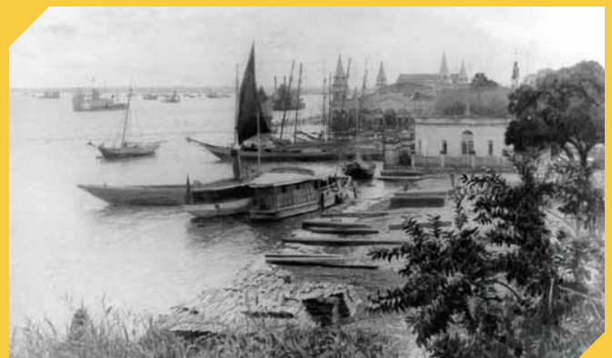
Saint-Pierre de la Martinique en 1896.