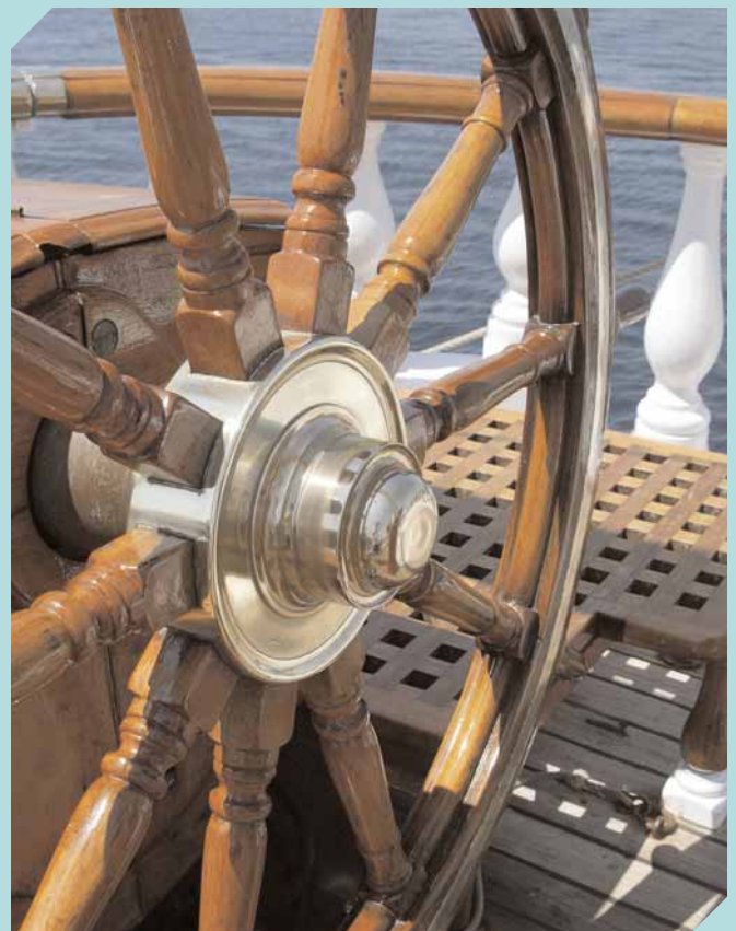
La barre à roue.