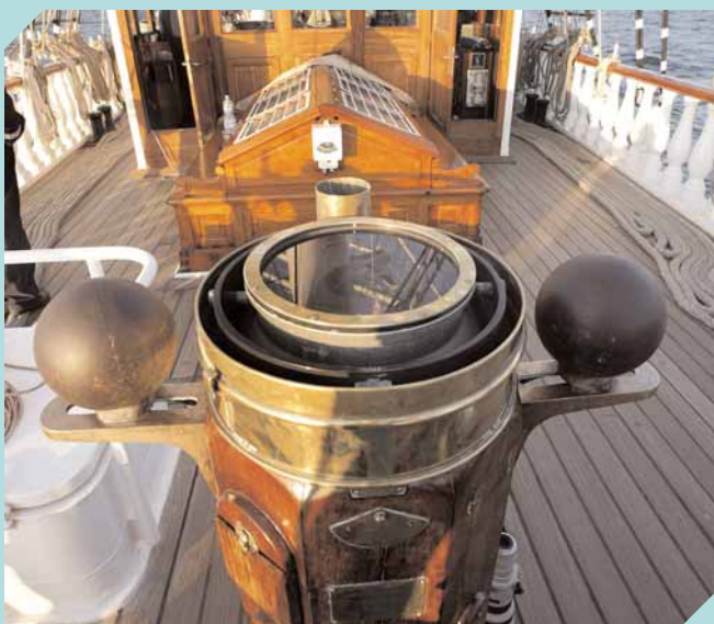
Le compas et la tortue.

De l'avant de l'étrave sous le beaupré jusqu'à l'arrière de l'étambot, le Belem mesure 50,96 m. La plus grande largeur est de 8,80 m. La cale occupait toute la partie centrale du bateau, sur une longueur de 33 mètres pour une capacité de 1 000 m 3 . À l'origine, l'équipage de 8 hommes habitait au niveau de la cuisine actuelle, à l'avant du navire. Sous le gaillard étaient logés le cuisinier et un mousse. À l'arrière vivaient le capitaine, le second capitaine et un mousse. Ces derniers logements surplombaient deux caisses à eau de 2 500 litres chacune, ainsi que la cambuse (jusqu'en 1914). Le Belem est un navire à coffres, c'est-à-dire qu'il présente une partie surélevée à l'avant (le gaillard) et à l'arrière (la dunette). Entre les deux se trouve un coffre fermé par les pavois sur bâbord et sur tribord.