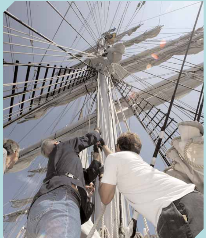
Des stagiaires en action sur le Belem .