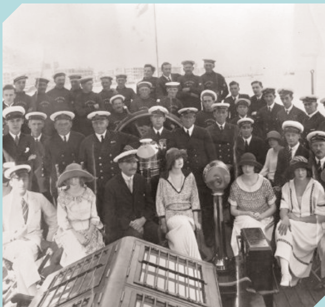
Sir Arthur Ernest Guinness, sa famille et l'équipage de Fantôme II , en 1923.

Le Belem devient par la suite la propriété du fameux brasseur (fabricant de bière) irlandais sir Arthur Ernest Guinness. Il subit alors d'autres transformations et il est rebaptisé Fantôme II . Sir Arthur Ernest embarque en 1923 pour un tour du monde, via Panamá et Suez. Fantôme II est désarmé en 1939, à l'île de Wight. Pendant la guerre, il abrite le quartier général des Forces françaises libres, secteur des vedettes rapides.